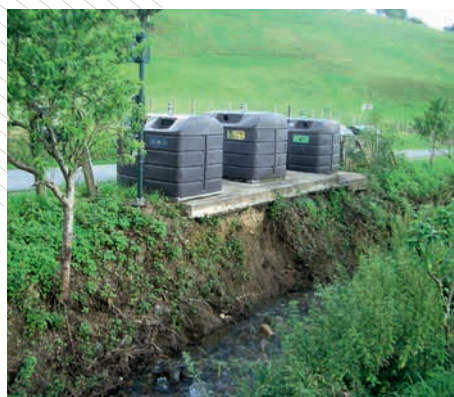
Dommages causés lors des inondations du 4 juillet dernier sur la Commune

« Cette station était très attendue par tous les Ezpeletar. Cette construction représente un défi écologique, technologique et économique. Elle a été réalisée pour garantir le respect et la protection de l'environnement dans un esprit de développement maîtrisé et durable » a dit Jean-Marie Iputcha. ■